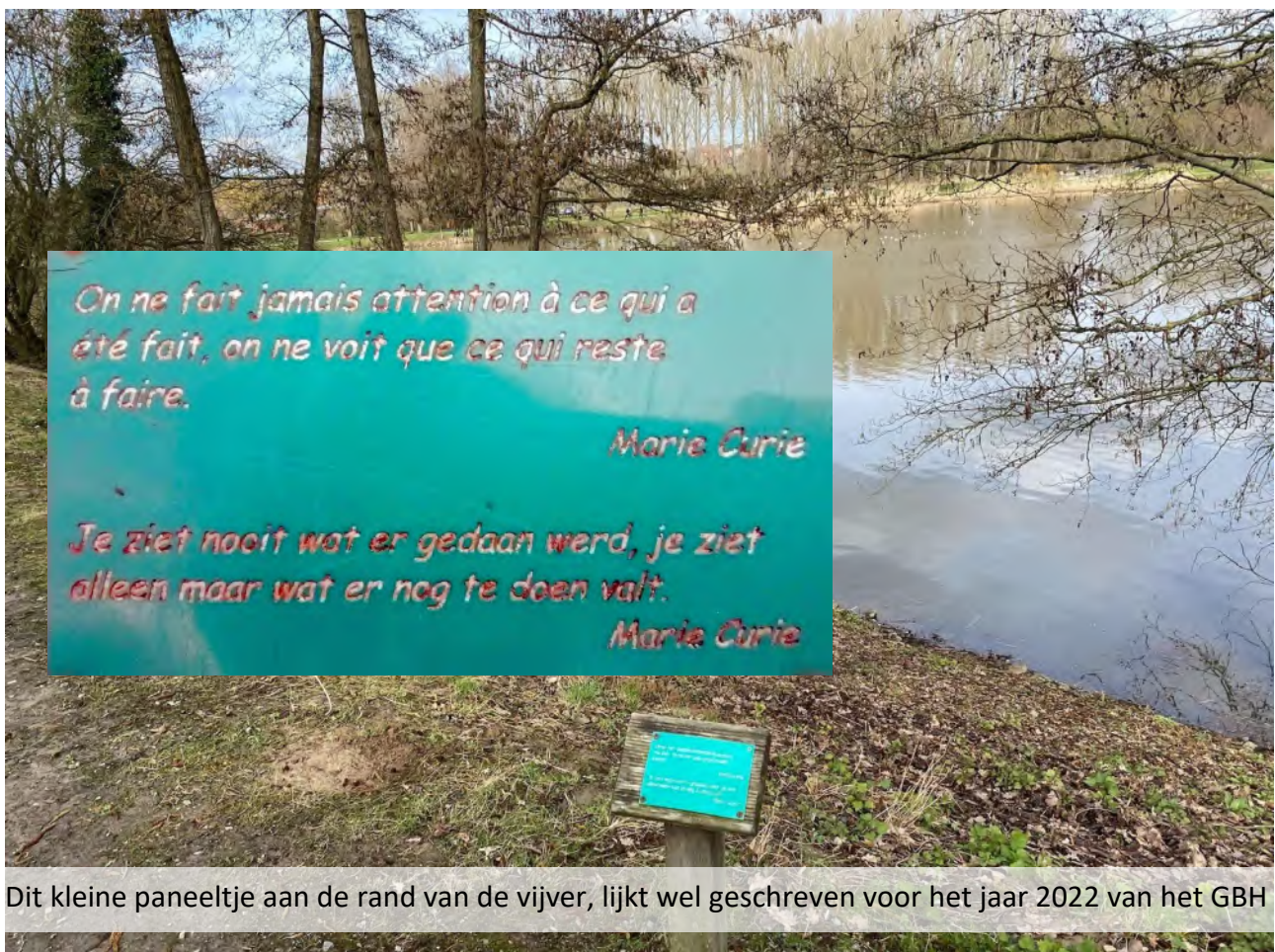
Dit kleine paneeltje aan de rand van de vijver, lijkt wel geschreven voor het jaar 2022 van het GBH