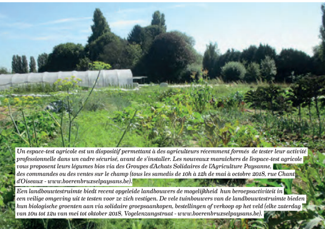
Un espace-test agricole est un dispositif permettant à des agriculteurs récemment formés de tester leur activité professionnelle dans un cadre sécurisé, avant de s'installer. Les nouveaux maraichers de l'espace-test agricole vous proposent leurs légumes bios via des Groupes d'Achats Solidaires de l'Agriculture Paysanne, des commandes ou des ventes sur le champ (tous les samedis de 10h à 12h de mai à octobre 2018, rue Chant d'Oiseaux - www.boerenbruxselpaysans.be). Een landbouwtestruimte biedt recent opgeleide landbouwers de mogelijkheid hun beroepsactiviteit in een veilige omgeving uit te testen voor ze zich vestigen. De vele tuinbouwers van de landbouwtestruimte bieden hun biologische groenten aan via solidaire groepsaankopen, bestellingen of verkoop op het veld (elke zaterdag van 10u tot 12u van mei tot oktober 2018, Vogelzangstraat - www.boerenbruxselpaysans.be).