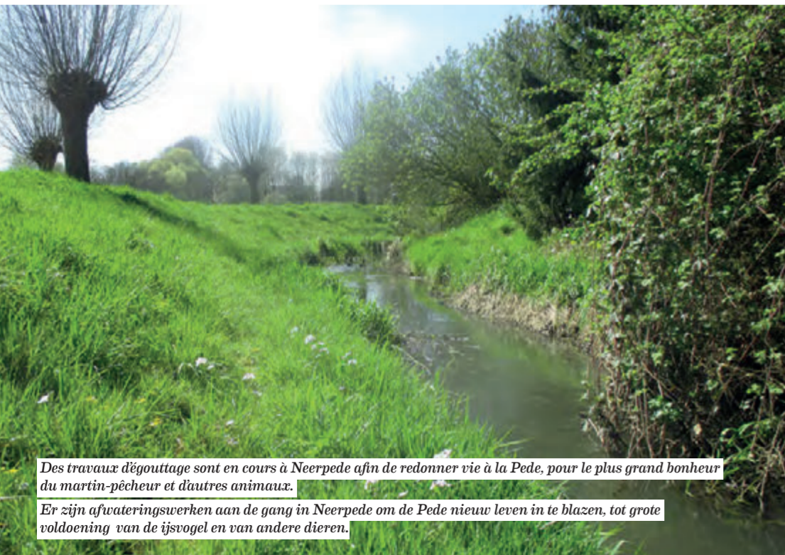
Des travaux d'égouttage sont en cours à Neerpède afin de redonner vie à la Pede, pour le plus grand bonheur du martin-pêcheur et d'autres animaux. Er zijn afwateringswerken aan de gang in Neerpède om de Pede nieuw leven in te blazen, tot grote voldoening van de tjsvogel en van andere dieren.