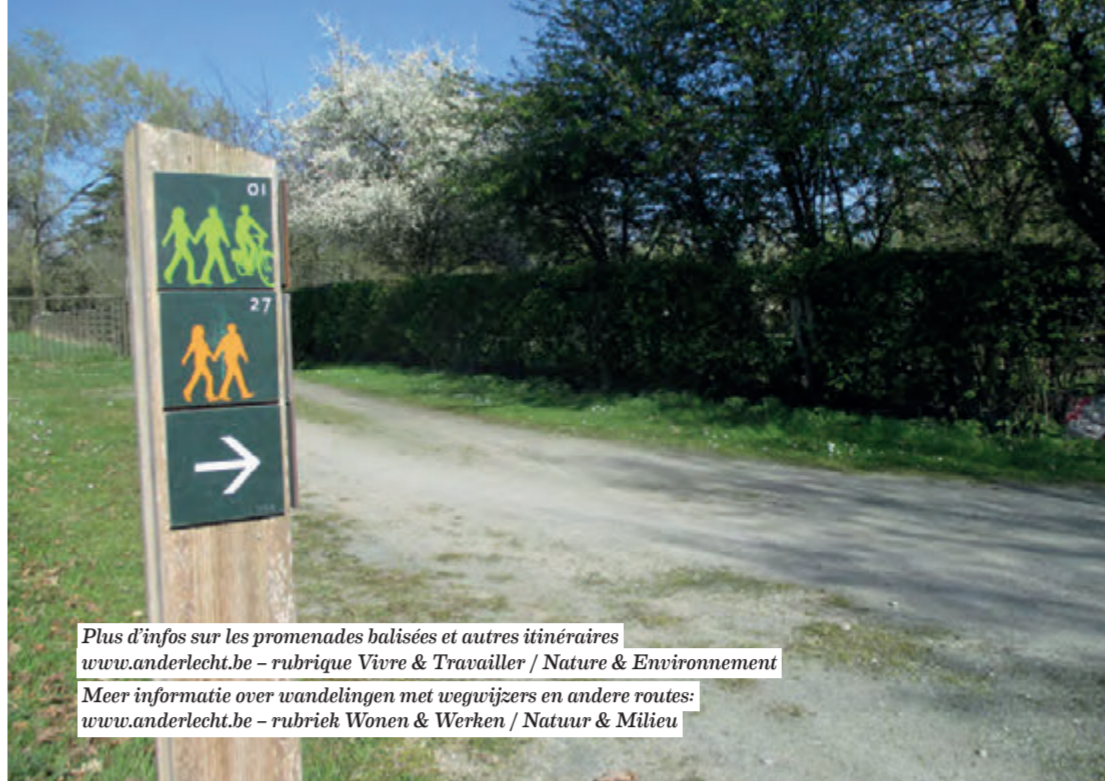
Plus d'infos sur les promenades balisées et autres itinéraires www.anderlecht.be - rubrique Vivre & Travailler / Nature & Environnement Meer informatie over wandelingen met wegrijzers en andere routes: www.anderlecht.be - rubriek Wonen & Werken / Natuur & Milieu