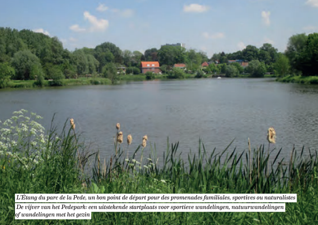
L'Étang du parc de la Pede, un bon point de départ pour des promenades familiales, sportives ou naturalistes De vijver van het Pedepark: een uitstekende startplaats voor sportieve wandelingen, natuurwandelingen of wandelingen met het gezin