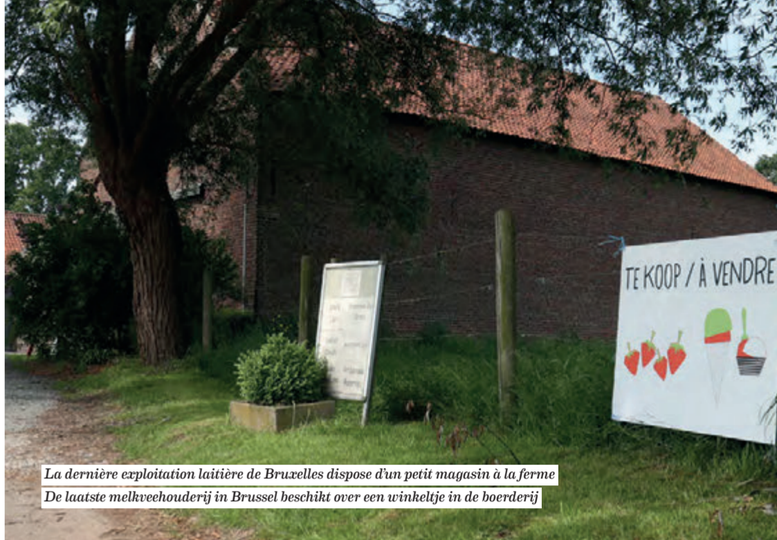
La dernière exploitation laitière de Bruxelles dispose d'un petit magasin à la ferme De laatste melkveehouderij in Brussel beschikt over een winkeltje in de boerderij