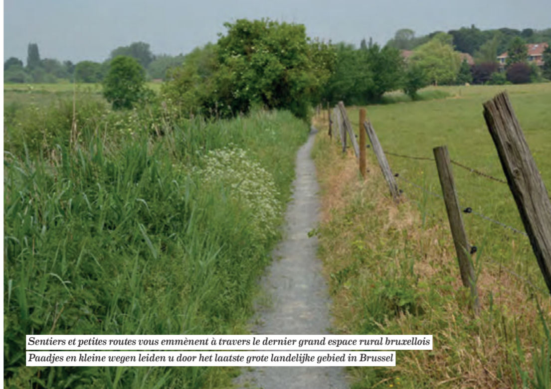
Sentiers et petites routes vous emmènent à travers le dernier grand espace rural bruxellois Paadjes en kleine wegen leiden u door het laatste grote landelijke gebied in Brussel