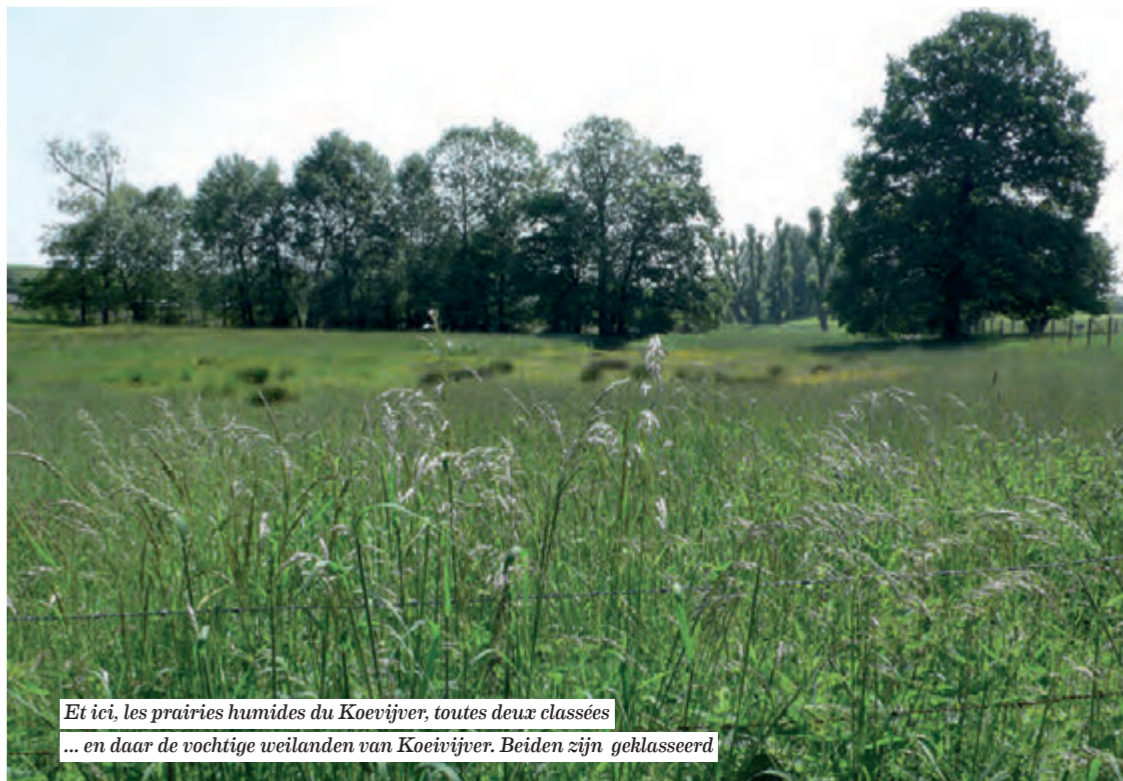
Et ici, les prairies humides du Koevijver, toutes deux classées ... en daar de vochtige weilanden van Koevijver. Beiden zijn geklasseerd