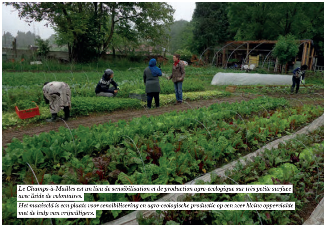
Le Champs-à-Mailles est un lieu de sensibilisation et de production agro-écologique sur très petite surface avec l'aide de volontaires. Het maaiveld is een plaats voor sensibilisering en agro-ecologische productie op een zeer kleine oppervlakte met de hulp van vrijwilligers.