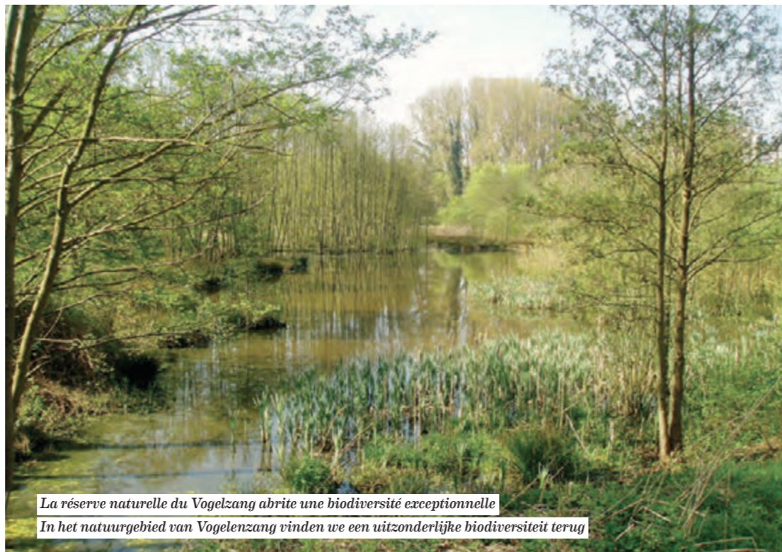
La réserve naturelle du Vogelzang abrite une biodiversité exceptionnelle In het natuurgebied van Vogelzang vinden we een uitzonderlijke biodiversiteit terug