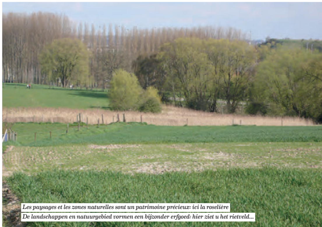
Les paysages et les zones naturelles sont un patrimoine précieux: ici la roselière De landschappen en natuurgebied vormen een bijzonder erfgoed: hier ziet u het rietveld...